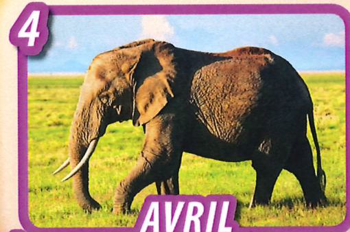
AVRIL Les animaux de la savane

SORTIES : visite de fermes de la presqu'île. la Fabrique des Savoirs, parc Zoologique de Clères.