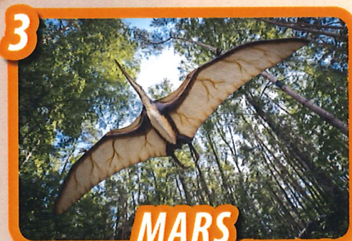
MARS Les animaux du ciel