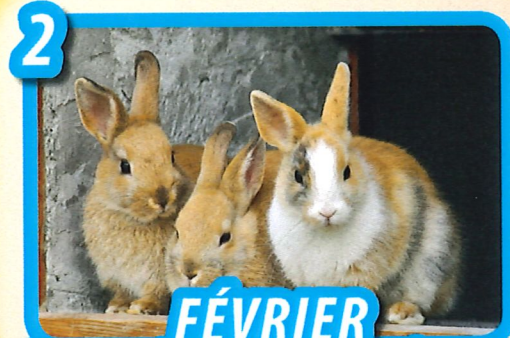
FÉVRIER Les animaux de la ferme